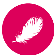
Puf si pana de gasca